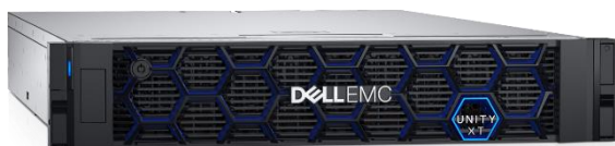
Краткое описание гибридной системы хранения Dell EMC Unity XT

© Dell Inc. или ее дочерние компании, 2019 г.