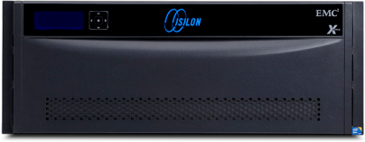
EMC Isilon X400