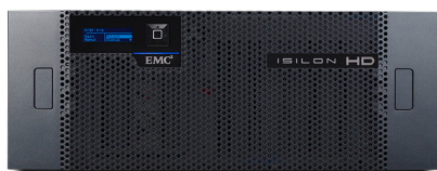
EMC Isilon HD400